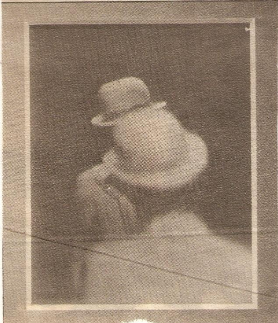
När man betraktar det här hologrammet rakt framifrån skymms den bakre mannens ansikte. Genom att titta lite från sidan framträder den skymda mannen tydligt.